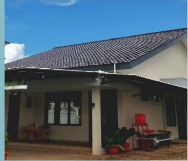
Gedung GPIB Jurang Mangu

RABU, 19 FEBRUARI 2025 PUKUL : 19.00 WIB